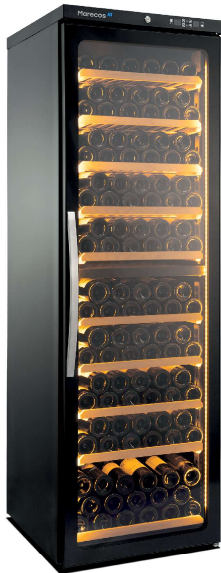
CV 450 PV 2T EXCLUSIVE