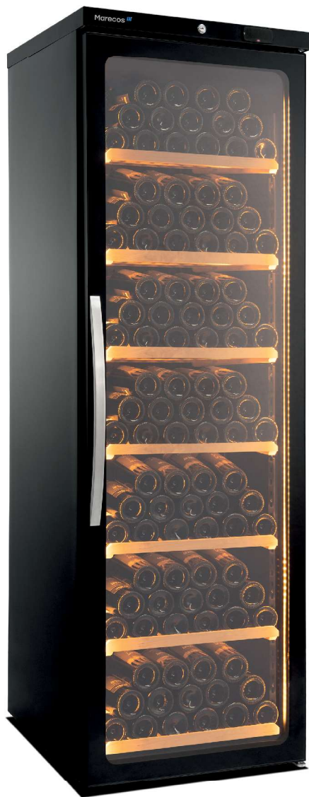
CV 450 PV EXCLUSIVE